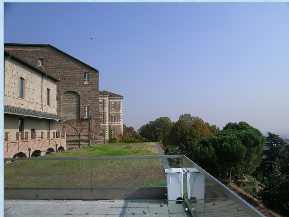
RILIEVO FOTOGRAFICO n° 1:

Architettura di origini medievali che, in una posizione strategica dal punto di vista militare ha subito distruzioni e successive ricostruzioni fino alla sua forma definitiva del progetto (mai completato) dell'architetto Juvarrà. A partire dagli anni settanta del XX secolo, se ne cominciò il restauro. Oggi è costituito da un'armonizzazione tra strutture contemporanee e strutture d'epoca - come la suggestiva Manica Lunga - che ospita sia una collezione permanente che mostre temporanee.