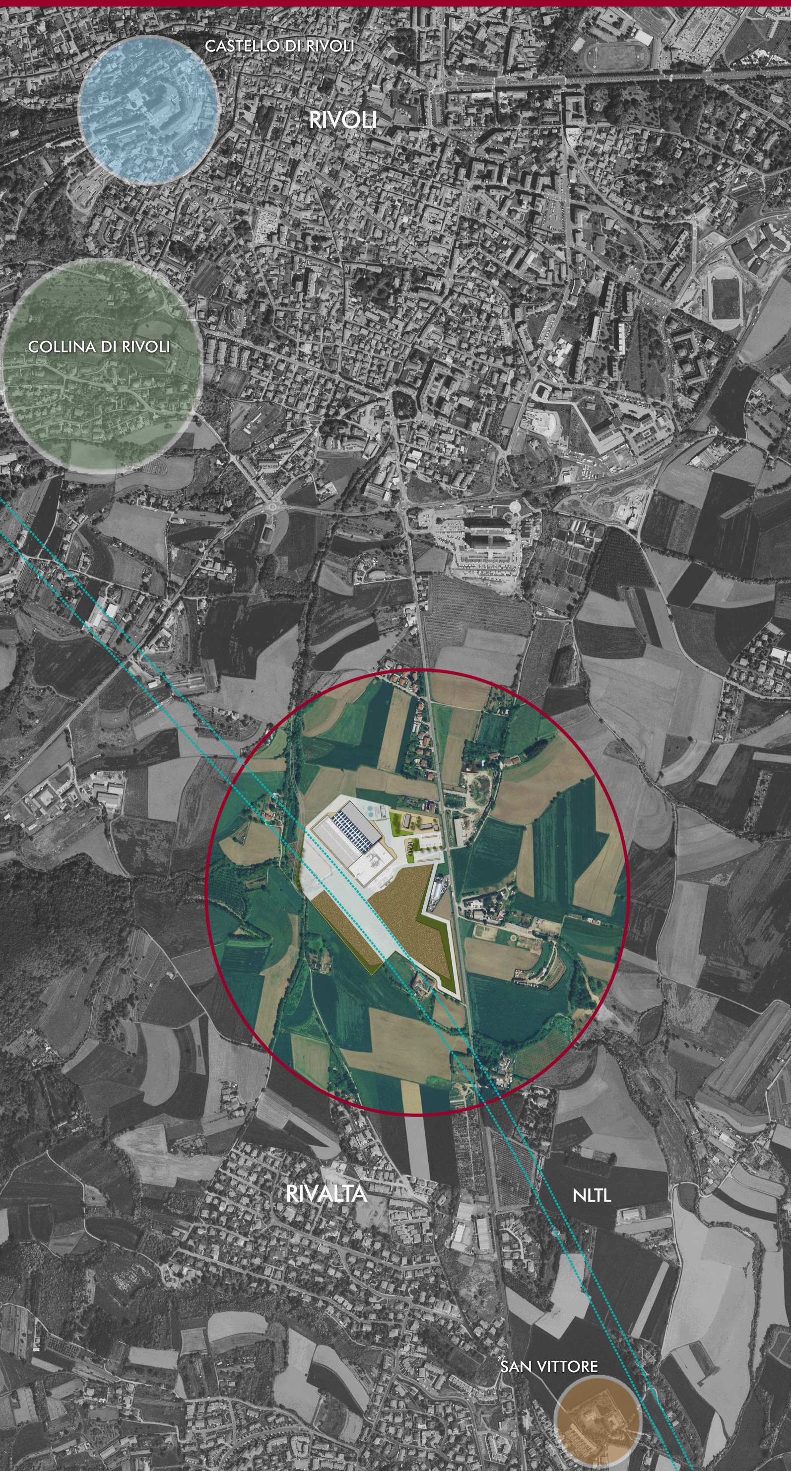
CASTELLO DI RIVOLI